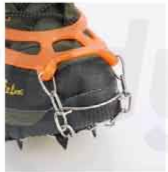
OUTDOOR 13-TOOTH CRAMPONS OUTDOOR STAINLESS STEEL 13-TOOTH CRAMPONS MOUNTAINEERING ICE CLIMBING SNOW CLAWS ANTI-SKID SHOE COVER SHOE CHAIN