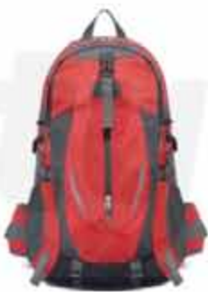
20 LITERS OUTDOOR BACKPACK

CUSTOMIZABLE 20 LITERS OUTDOOR BACKPACK MADE OF OXFORD CLOTH WITH JAQUARD TECHNIQUE. WATERPROOF RESISTANT TO ANY SITUATION