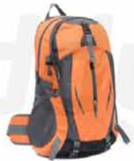
20 LITERS OUTDOOR BACKPACK

CUSTOMIZABLE 20 LITERS OUTDOOR BACKPACK MADE OF OXFORD CLOTH WITH JAQUARD TECHNIQUE. WATERPROOF RESISTANT TO ANY SITUATION