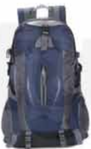
20 LITERS OUTDOOR BACKPACK

CUSTOMIZABLE 20 LITERS OUTDOOR BACKPACK MADE OF OXFORD CLOTH WITH JAQUARD TECHNIQUE. WATERPROOF RESISTANT TO ANY SITUATION