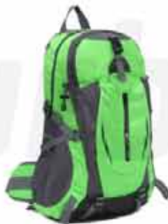
20 LITERS OUTDOOR BACKPACK

CUSTOMIZABLE 20 LITERS OUTDOOR BACKPACK MADE OF OXFORD CLOTH WITH JAQUARD TECHNIQUE. WATERPROOF RESISTANT TO ANY SITUATION