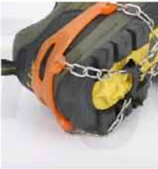
OUTDOOR 13-TOOTH CRAMPONS OUTDOOR STAINLESS STEEL 13-TOOTH CRAMPONS MOUNTAINEERING ICE CLIMBING SNOW CLAWS ANTI-SKID SHOE COVER SHOE CHAIN