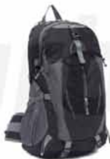
20 LITERS OUTDOOR BACKPACK

CUSTOMIZABLE 20 LITERS OUTDOOR BACKPACK MADE OF OXFORD CLOTH WITH JAQUARD TECHNIQUE. WATERPROOF RESISTANT TO ANY SITUATION