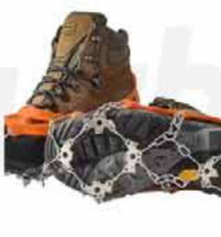
OUTDOOR 13-TOOTH CRAMPONS OUTDOOR STAINLESS STEEL 13-TOOTH CRAMPONS MOUNTAINEERING ICE CLIMBING SNOW CLAWS ANTI-SKID SHOE COVER SHOE CHAIN