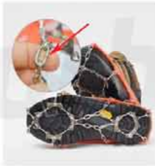
OUTDOOR 13-TOOTH CRAMPONS OUTDOOR STAINLESS STEEL 13-TOOTH CRAMPONS MOUNTAINEERING ICE CLIMBING SNOW CLAWS ANTI-SKID SHOE COVER SHOE CHAIN