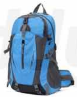
20 LITERS OUTDOOR BACKPACK

CUSTOMIZABLE 20 LITERS OUTDOOR BACKPACK MADE OF OXFORD CLOTH WITH JAQUARD TECHNIQUE. WATERPROOF RESISTANT TO ANY SITUATION