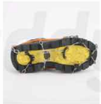
OUTDOOR 13-TOOTH CRAMPONS OUTDOOR STAINLESS STEEL 13-TOOTH CRAMPONS MOUNTAINEERING ICE CLIMBING SNOW CLAWS ANTI-SKID SHOE COVER SHOE CHAIN