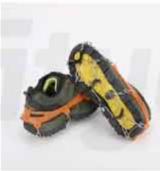
OUTDOOR 13-TOOTH CRAMPONS OUTDOOR STAINLESS STEEL 13-TOOTH CRAMPONS MOUNTAINEERING ICE CLIMBING SNOW CLAWS ANTI-SKID SHOE COVER SHOE CHAIN