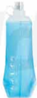
TPU SILICONE SOFT FLASK

CUSTOMIZABLE 100% TPU SILICONE FOLDABLE SOFT FLASK BPA FREE WITH A CAPACITY OF 180ML