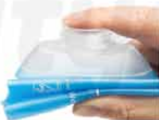
TPU SILICONE SOFT FLASK

CUSTOMIZABLE 100% TPU SILICONE FOLDABLE SOFT FLASK BPA FREE WITH A CAPACITY OF 180ML