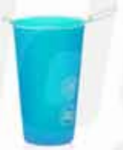
TPU SILICONE CUP CUSTOMIZABLE 100% TPU SILICONE FOLDABLE CUP BPA FREE WITH A CAPACITY OF 180ML