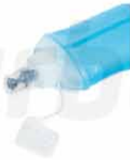
TPU SILICONE SOFT FLASK

CUSTOMIZABLE 100% TPU SILICONE FOLDABLE SOFT FLASK BPA FREE WITH A CAPACITY OF 180ML