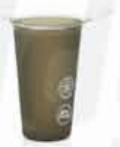
TPU SILICONE CUP CUSTOMIZABLE 100% TPU SILICONE FOLDABLE CUP BPA FREE WITH A CAPACITY OF 180ML