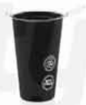
TPU SILICONE CUP CUSTOMIZABLE 100% TPU SILICONE FOLDABLE CUP BPA FREE WITH A CAPACITY OF 180ML