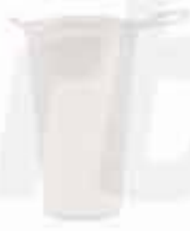
TPU SILICONE CUP CUSTOMIZABLE 100% TPU SILICONE FOLDABLE CUP BPA FREE WITH A CAPACITY OF 180ML