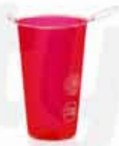
TPU SILICONE CUP CUSTOMIZABLE 100% TPU SILICONE FOLDABLE CUP BPA FREE WITH A CAPACITY OF 180ML