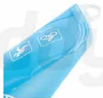
TPU SILICONE SOFT FLASK

CUSTOMIZABLE 100% TPU SILICONE FOLDABLE SOFT FLASK BPA FREE WITH A CAPACITY OF 180ML