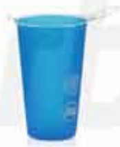
TPU SILICONE CUP CUSTOMIZABLE 100% TPU SILICONE FOLDABLE CUP BPA FREE WITH A CAPACITY OF 180ML